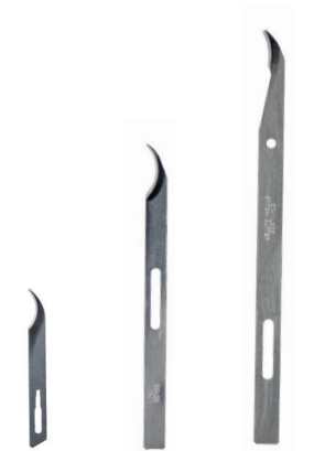
standard midi lang